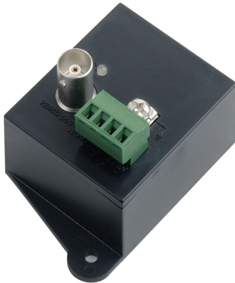
Рис. 1 Внешний вид ТТА111VНА.