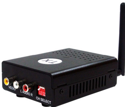
Рис. 1 Внешний вид передатчика WT2.4/9 (WT2.4/9(2))